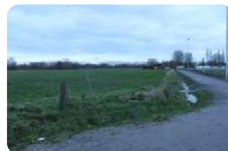
Uitbreidingsmogelijkheden Uitgevoerd in 2019