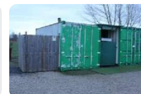
Uitbreiding stockageruimtes Uitgevoerd in 2018